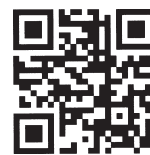
携帯用 QR コード

実際に通信課程の授業風景をご覧いただき、Sobiの通信課程で学ぶ方の表情や雰囲気をご理解いただく良い機会になっています。授業のある土曜日を中心に午前11時より午後4時まで受付可能です。詳しくはお電話またはホームページでご確認ください。